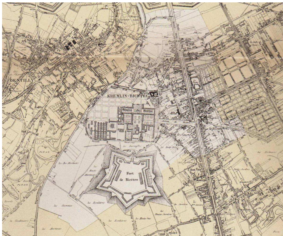
Image 5 : Le Kremlin-Bicêtre en 1898 – Emplacement actuel de la place de la mairie